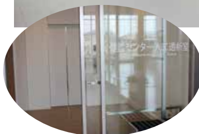
正面入口にある 健診用の出入口