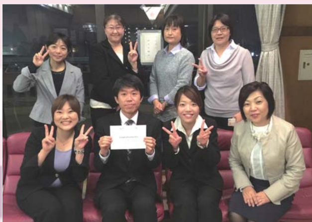
喜びのピンクリボン・プロジェクトメンバー