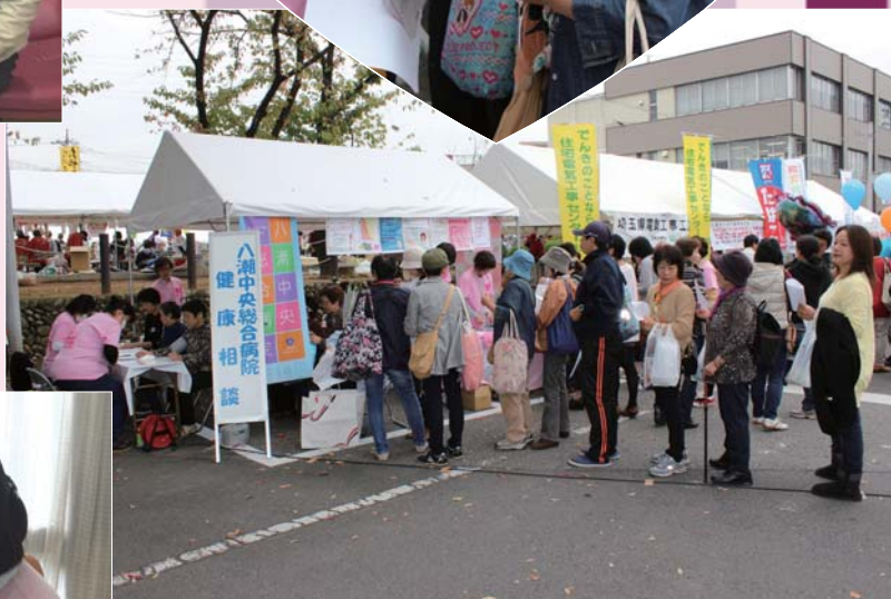
▲やしお市民まつりでの啓発活動（2014. 10. 26）