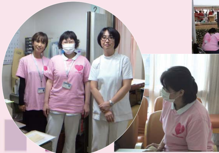
▲日曜乳がん検診（2014. 11. 30）