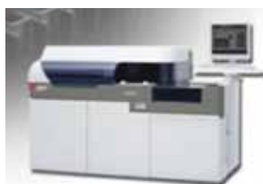
ベックマン・コールター AU680