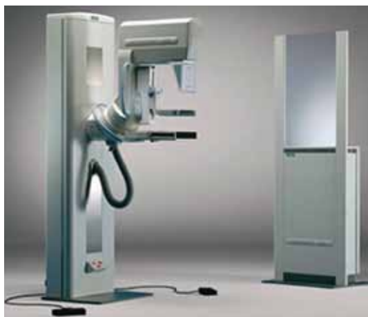
マンモグラフィ機械（SIEMENS）

当院は草加市・八潮市 がん検診無料クーポン券が利用できる 検診指定医療機関です。 子宮頸がん検診は婦人科外来で行っております。